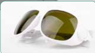
Sicherheitsbrillen schützen Ihr Augenlicht!

Feste Programmierungen stehen als geprüfte Vorinstallationen für die wichtigsten therapeutischen und chirurgischen Indikationen zur Verfügung.