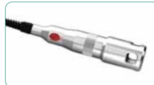
Handstück zur therapeutischen Behandlung!