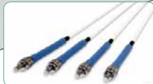
Fasern für verschiedene Indikationen!