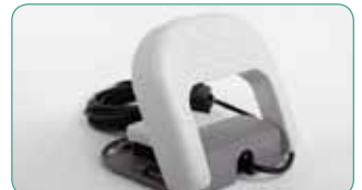
Fußsteuerung gibt Ihnen Handfreiheit!